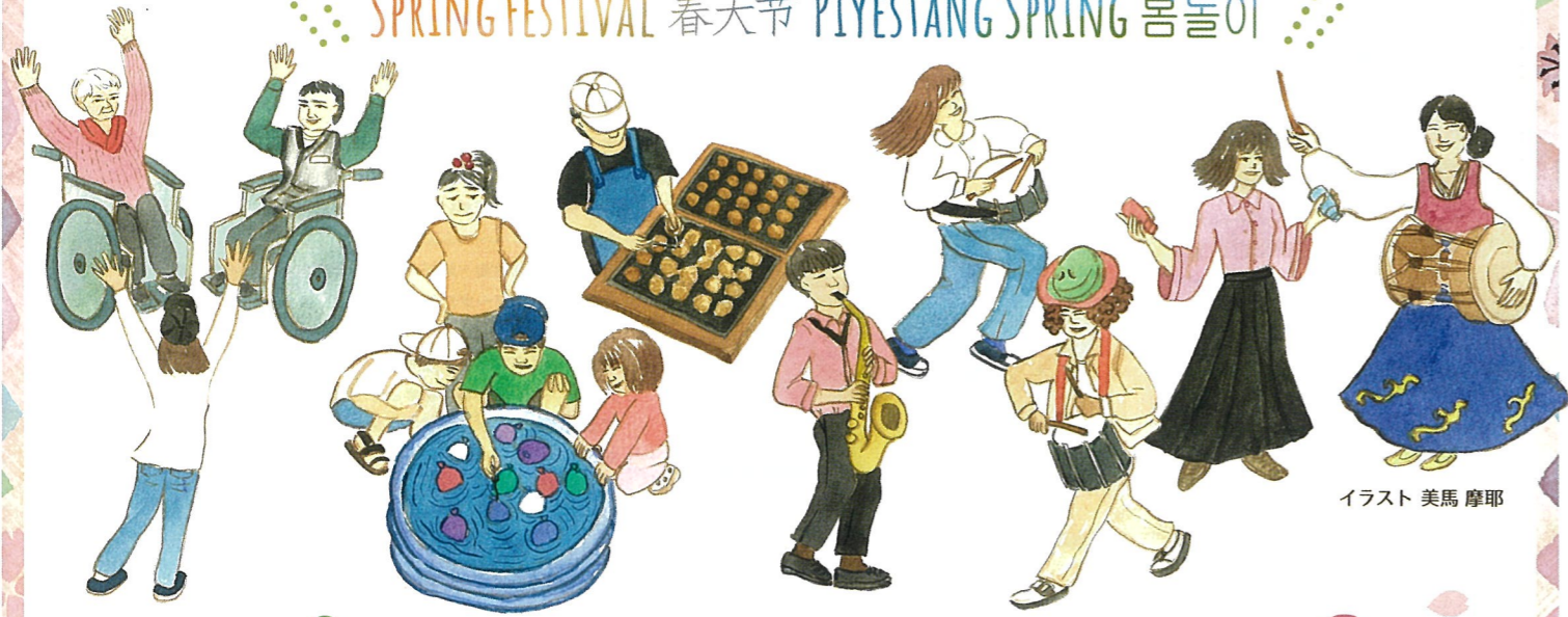
イラスト 美馬 摩耶

この街から広がる、笑顔の輪 SPRING FESTIVAL 春天节 PIYESTANG SPRING 봄놀이