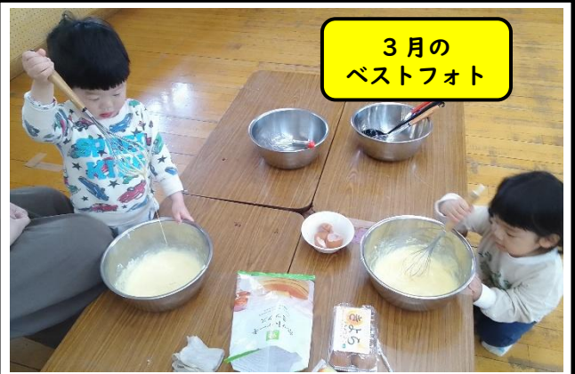
3月の ベストフォト