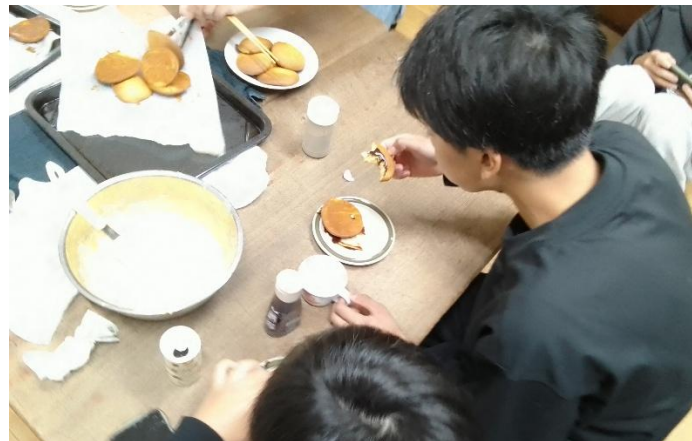
2月クッキングでは佐賀県の丸ぼうろをつくりました