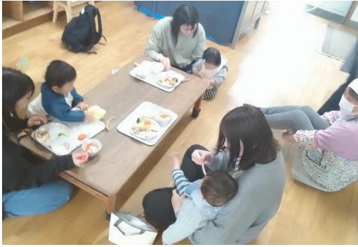
月齢に合わせた離乳食を学べる「まちのきゅうしょくしつ」